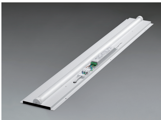
Masterlites kundanpassad lösning